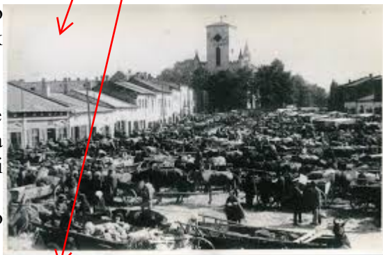
Zd.. nr 2

W latach 1975–1998 miasto administracyjnie należało do województwa częstochowskiego.